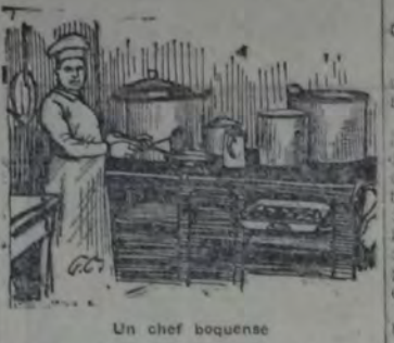
Un chef boquense

La Bolsa de trabajo es atendida por turno por dos miembros de la Comisión administrativa de la sociedad, siendo este cargo, como todos los que confiere el convenio, obligatorio y gratuito.