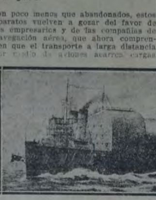
Barco acondicionado para el transporte de dirigibles rígidos.

El soplo un poco de viento y las maniobras son muy peligrosas: el dirigible puede escaparse de las manos que lo tienen amarrado, o puede dar violentamente contra el suelo y aplastar a los hombres.