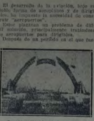
Construcción de los marcos de madera para vaciar los arcos de cemento armado de un hangar de dirigibles.