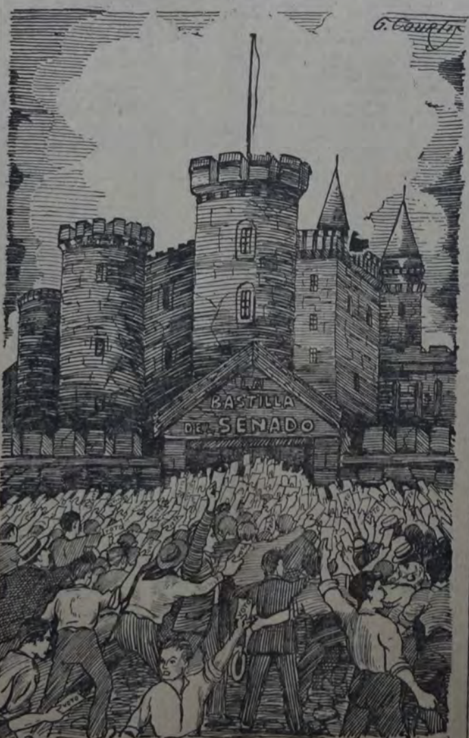
El pueblo, esgrimiendo la formidable arma del voto, asalta la Bastilla argentina.

yecto de presupuesto desconocido. Ni en los tiempos del más erudo incondicionalismo se encontrarían oficialistas de tan buena voluntad!