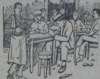
Clientes que "matan el tiempo"